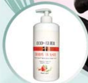
ELIER BODY WASH Miękkie naturalne mydło do pielęgnacji ciała i rąk

Międzynarodowa grupa naukowców nazwała ELIĒR ósmym cudem świata (Wnioski naukowców z Samara Medical University) To jedyny i unikalny surowiec na świecie!