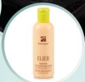
ELIER ORGANIC MUD SHAMPOO Szampon z organicznym błotem do włosów suchych / zniszczonych / odwodnionych