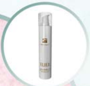
ELIER ANTI-CELLULITE GEL Żel antycellulitowy