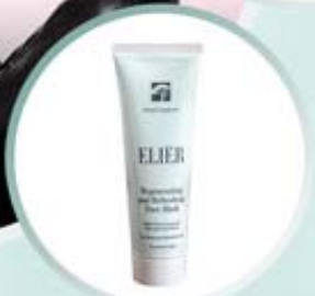
ELIER REGENERATING AND REFRESHING FACE MASK Odmładzająca i odświeżająca maska na twarz