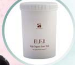
ELIER HIGH ORGANIC MOOR MASK Organiczna maska błotna