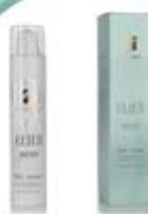
ELIER WOW RICH CREAM Odżywczy krem na suchą i bardzo zniszczoną skórę